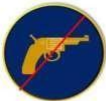
Armas de fuego