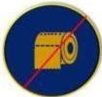
Rollos de papel